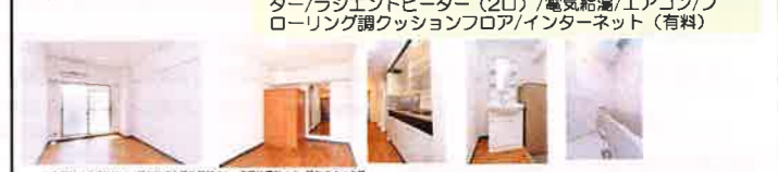
【仲介】●取引条件有効期限 2018年9月30日迄

●設備 カードキー/駐輪場/BS・CS・CS110アンテナ/エレベーター/ラジエントヒーター (2口) /電気給湯/エアコン/フローリング調クッションフロア/インターネット (有料)