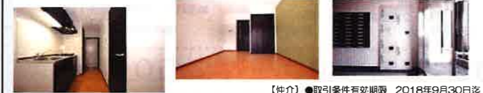
【仲介】●取引条件有効期限 2018年9月30日迄

●設備 防犯カメラ/駐輪場/バイク置き場 (50cc) /ガスコンロ2口 (備付) /ガス給湯/エアコン/中扉 (引き戸) /フローリング調硬質フロア/インターネット専用回線/浴室乾燥機/温水洗浄便座/宅配BOX/自動湯張り・追炊き機能