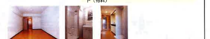
【仲介】●取引条件有効期限 2018年9月30日迄

●設備 カードキー/駐輪場/バイク置き場 (50ccのみ) /BS/ラジエントヒーター (2口) /電気給湯/エアコン/中扉/フローリング調硬質フロア/インターネット (有料)