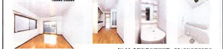
【仲介】●取引条件有効期限 2018年9月30日迄

●設備 駐輪場/バイク置き場 (50ccのみ) /カードキー/BS/ラジエントヒーター (2口) /ガス給湯/エアコン/中扉 (引き戸) /フローリング調クッションフロア/インターネット (有料) /