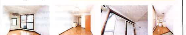
【仲介】●取引条件有効期限 2018年9月30日迄

●設備 駐輪場/BS/ガスコンロ (1口) 持込/ガス給湯/エアコン/フローリング調クッションフロア/インターネット (有料)