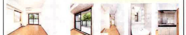
【仲介】●取引条件有効期限 2018年9月30日迄

●設備 カードキー/駐輪場/バイク置き場 (50ccのみ) /ラジエントヒーター (2口) /電気給湯/エアコン/インターネット (有料) /宅配ロッカー