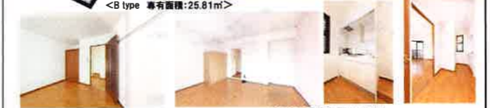
【仲介】●取引条件有効期限 2018年9月30日迄

●設備 カードキー/駐輪場/バイク置き場 (50ccのみ) /ガスコンロ (1口備付) /ガス給湯/エアコン/中扉/フローリング調クッションフロア/都市ガス