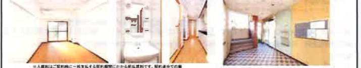
【仲介】●取引条件有効期限 2018年9月30日迄

●設備 カードキー/駐輪場/バイク置き場 (50ccのみ) /BS/ラジエントヒーター (2口) /電気給湯/エアコン/中扉/フローリング調硬質フロア/インターネット (有料) /防犯シャッター (1階のみ)