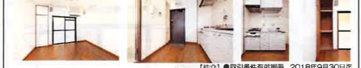
【仲介】●取引条件有効期限 2018年9月30日迄

●設備 駐輪場/バイク置き場 (50ccのみ) /BS/ガスコンロ (2口・要持込) /ガス給湯/エアコン/冷蔵庫 (C.Dタイプはなし) /中扉 (C.Dタイプはなし) /フローリング/インターネット (有料) /都市ガス