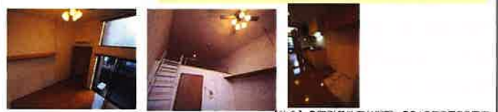
【仲介】●取引条件有効期限 2018年9月30日迄

●設備 カメラ付フロントオートロック/防犯カメラ/駐輪場/バイク置き場 (50ccのみ) /BS対面/ガスコンロ (2口) 備付/ガス給湯/エアコン/中扉 (開き戸) /フローリング調硬質フロア/インターネット専用無料