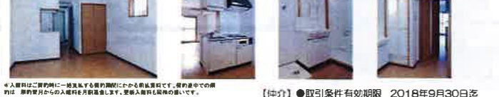
【仲介】●取引条件有効期限 2018年9月30日迄

●設備 駐輪場/カードキー/BS・CS110アンテナ/ラジエントヒーター (2口) /電気給湯/エアコン/中扉/フローリング調クッションフロア/インターネット (有料)