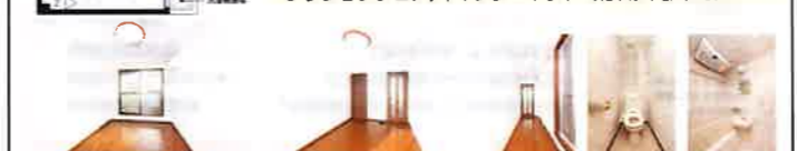
【仲介】●取引条件有効期限 2018年9月30日迄

●設備 カードキー/駐輪場/バイク置き場 (50ccのみ) /BS/温水洗浄便座/浴室乾燥機/IHコンロ (1口) /ガス給湯/エアコン/中扉/居室照明/フローリング (一部フローリング調クッションフロア) /インターネット (有料) /都市ガス